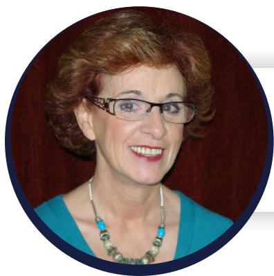
Élue à la fédération française de danse