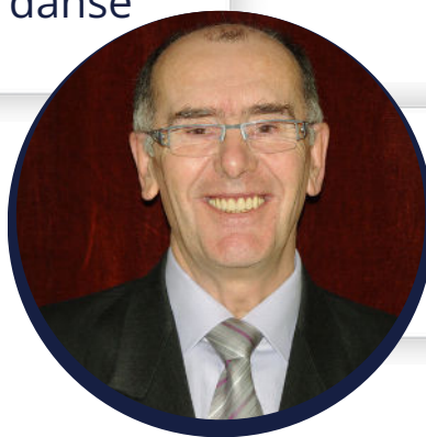
Président du comité départemental FFDanse des Haute-Vienne